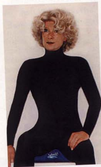
Diese Übung bringt Entlastung für Becken und Steissbein.

der «Sball» auf den Wellness-Reisen nach Abano angeboten. Vom Chauffeur erhalten die Passagiere den kleinen Gesundheitsball als Geschenk. Mittels eines achtminütigen Videos, welches über das Bordunterhaltungssystem gezeigt wird, wird man in die Grundübungen eingeführt. Übungen, die nicht nur für Busreisen sinnvoll sind, sondern auch daheim weiter angewandt werden können, sei es nun im Bürostuhl oder Fernsehsessel. Die Reaktionen sind eindeutig, das Angebot wird gerne angenommen, der «Sball» bewährt sich. «Es ist schön zu sehen, dass die Passagiere echte Freude an dem Ball haben und ihn auch tatsächlich benutzen. Ein